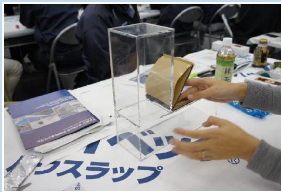
アクリルボックスを使い、バルコニーと手すり壁等3面交点となる部位の防水テープについても実際に施工体験。