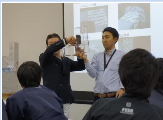
雨漏れ事故につながりやすい3面交点についての講義。