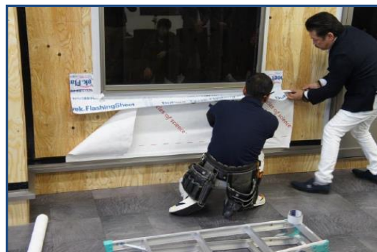
模擬棟を使い、防水紙の施工手順や施工のポイントを実際に目で見て、体験することができます。

現場の品質・施工精度の向上、2次防水への意識改革とレベルアップにつながるカリキュラムとなっております。現場の方のみならず、設計者の方もふるってご参加ください。