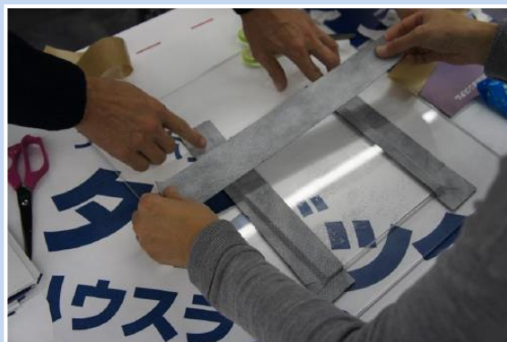
アクリル板を使用し、防水テープの張り方を実際に体験できる。