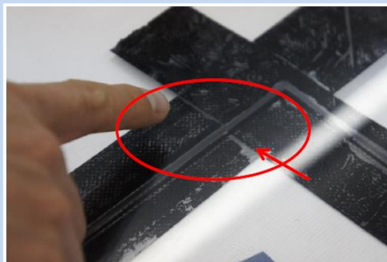
アクリル板の裏から防水テープの接着状況について確認。張り方によっては、水みちができてしまう場合もある。