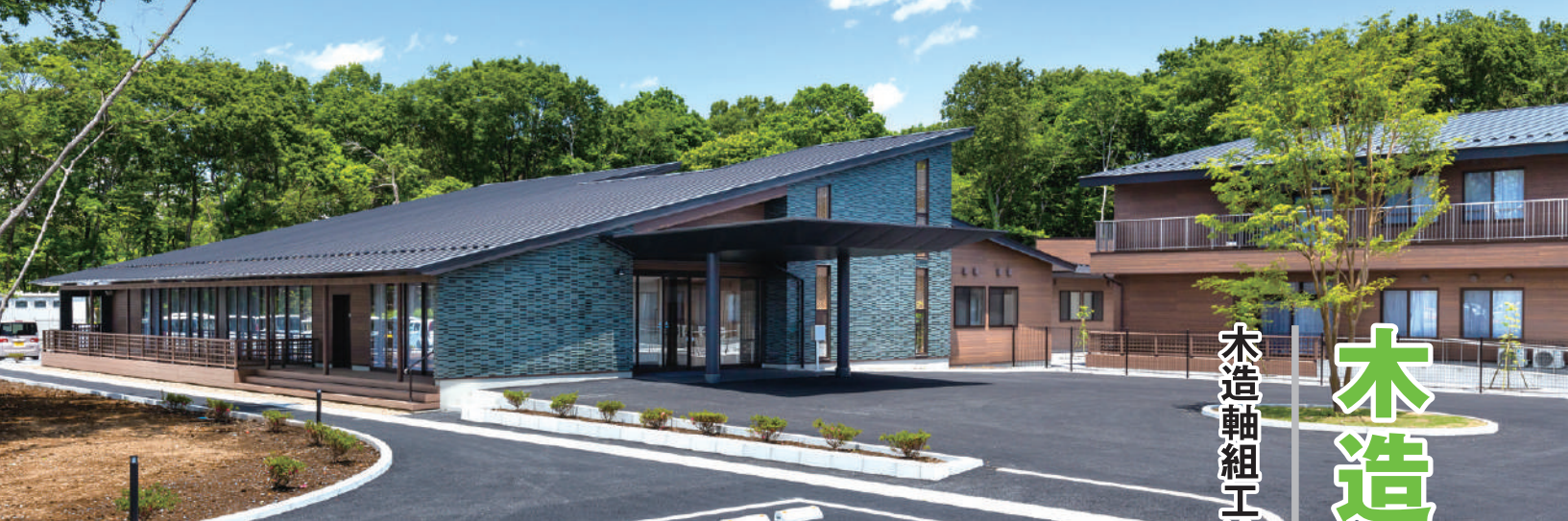
特別養護老人ホーム まごころの杜 (株)増山栄建築設計事務所

(一社)日本木造住宅産業協会(以下「木住協」)は、木造建築物の防耐火性能向上を目的に技術開発を重ね、主要構造部の耐火構造の国土交通大臣認定を取得し、木造軸組工法による耐火建築物の建築を推進しています。